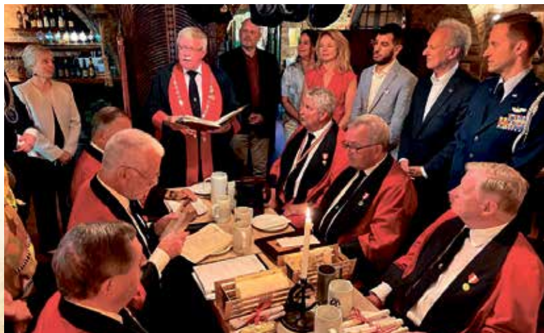
En af de glade optagelser i 2022.

Alle de nyoptagne kan nu tælle sig blandt Laugets mere end 8.000 medlemmer fra 104 forskellige nationer.